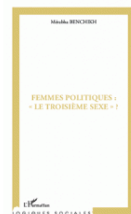
Femmes politiques "Le troisième sexe" Mérébha Benchikh