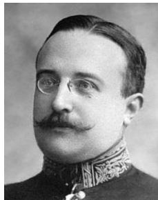
Jean Jaurès à l'Assemblée nationale, 1914

« C'est l'humanité entière qui doit agir, penser, vivre et l'on a bien tort de redouter que le suffrage des femmes soit une puissance de réaction, quand c'est par leur passivité et leur servitude qu'elles pèsent sur le progrès humain »