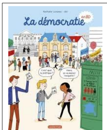
BD de Nathalie Loiseau Casterman 2017