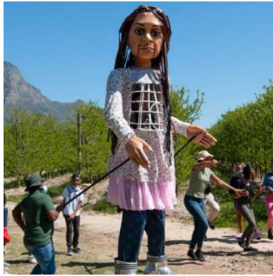
La petite Amal, marionnette géante représente une jeune réfugiée syrienne ; partie de Turquie en juillet, elle a rejoint la COP 26 lors de cette journée. Chaque étape de son long parcours (comme ici à Marseille) a été un évènement pour rappeler le devoir d'hospitalité aux enfants réfugiés